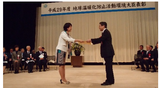
とかしき副大臣より表彰状授与